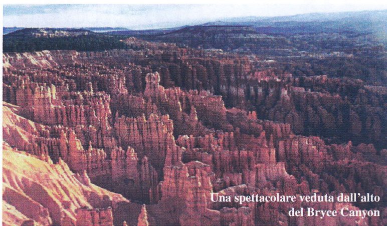
Una spettacolare veduta dall'alto del Bryce Canyon

Sfidando l'influenza "suina" che proprio nel mese di maggio cominciava a manifestarsi, un gruppo di soci della sezione di Roma dell'Ansmi (nella foto in basso) ha effettuato un viaggio nel Far West, attraversano ben otto Stati degli Usa, alla ricerca della natura.